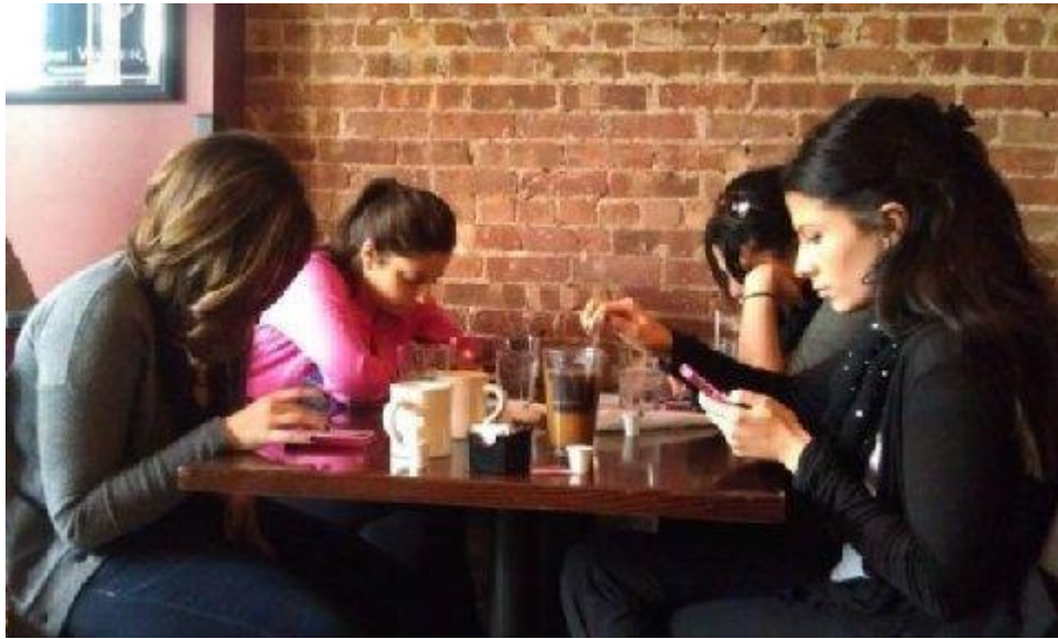
Prendre un café avec ses amis.

‘Je crains que le jour où la technologie dépassera notre besoin d’interaction humaine... le monde produira une génération d’imbéciles’ Albert Einstein