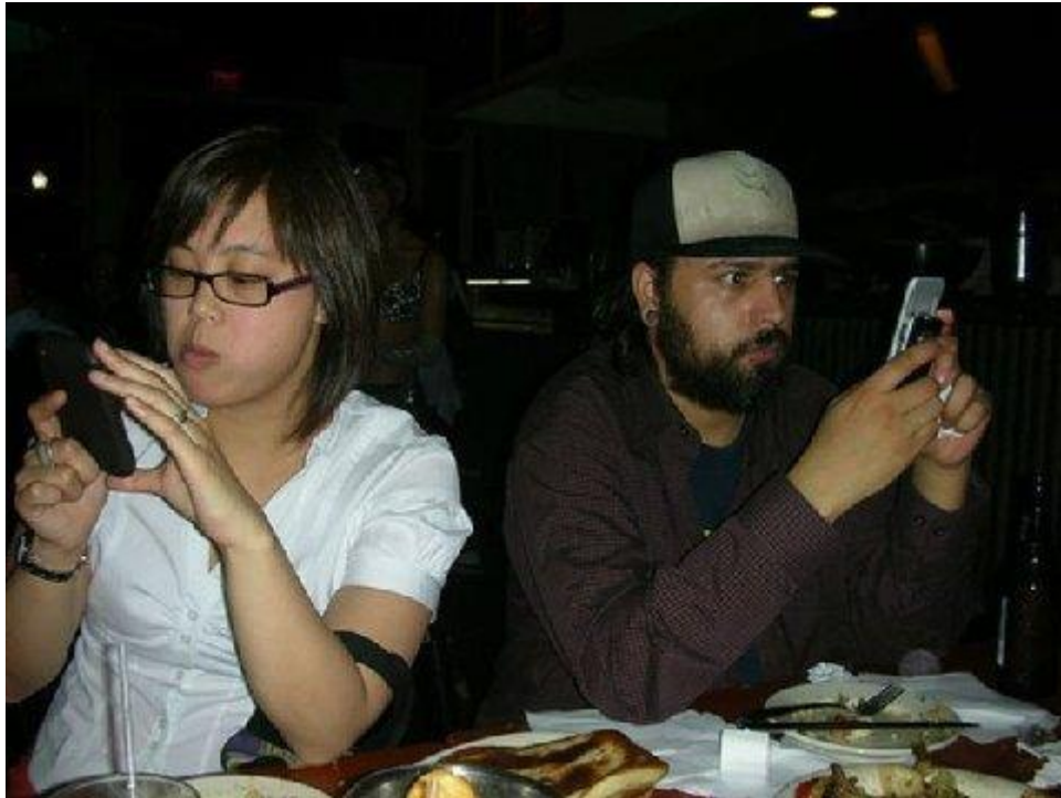
un rendez-vous amoureux.