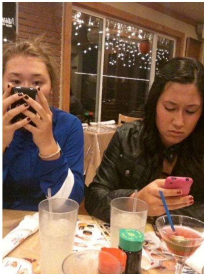
Une conversation avec sa meilleure copine