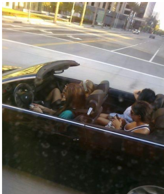
Profiter du paysage