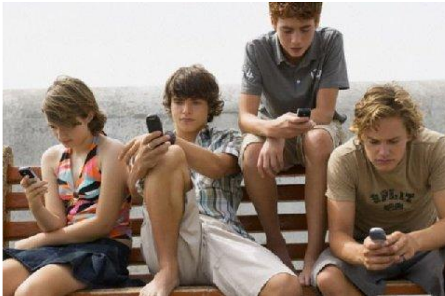
Un jour à la plage.